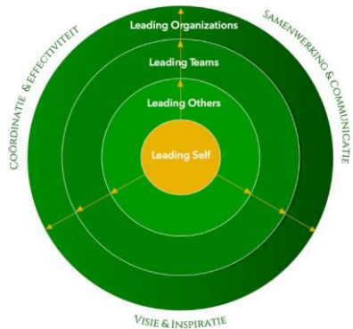
Model Leergang Leiderschap en Leergang Strategisch Leiderschap voor Praktijkgericht Onderzoek ~ AcademicVision, 2024