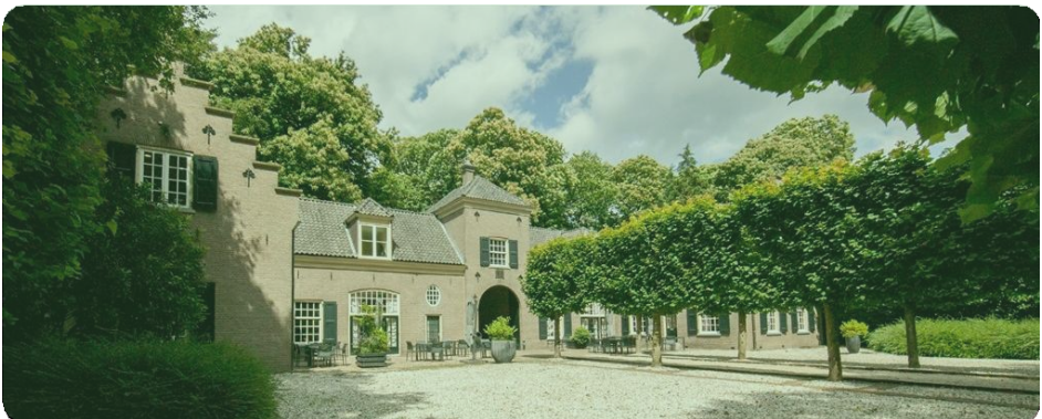
Landgoed Zonheuvel in Doorn.